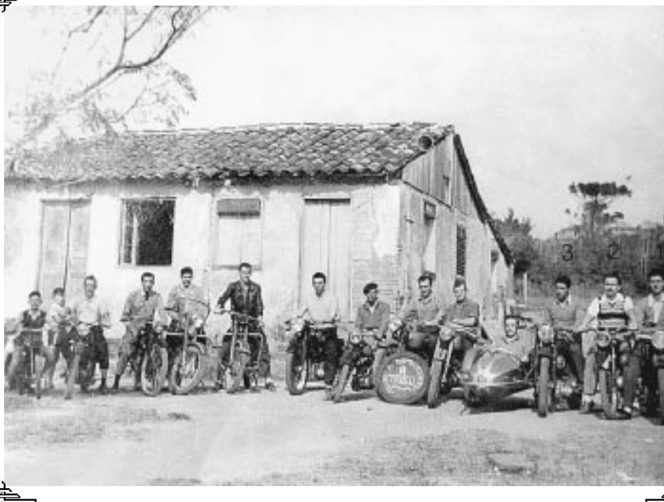
O Clube de Motociclistas A Tribu, diante da sede da entidade na Tristeza

A faixa da Tristeza ainda estava com sua pista de cimento com jeito de nova, por volta de 1953, quando por ela começaram a circular os integrantes do Clube de Motociclistas A Tribu . A foto desta página mostra aqueles intrépidos aventureiros de uma cidade de 400 mil habitantes em frente à sede do clube, na Rua Coronel Massot. O clube foi oficialmente fundado apenas em junho de 1958, mas anos antes seus integrantes circulavam pela cidade com seus "motociclos" e participavam das corridas que a cidade promovia. Foi uma época importante para o país, que teve a